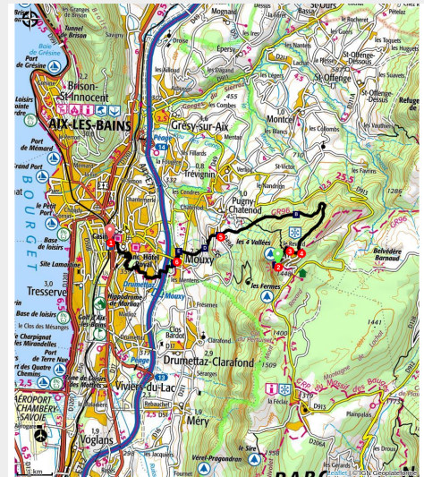
Sur les Traces de la Crémaillère - Tunnel de Pré Farnier