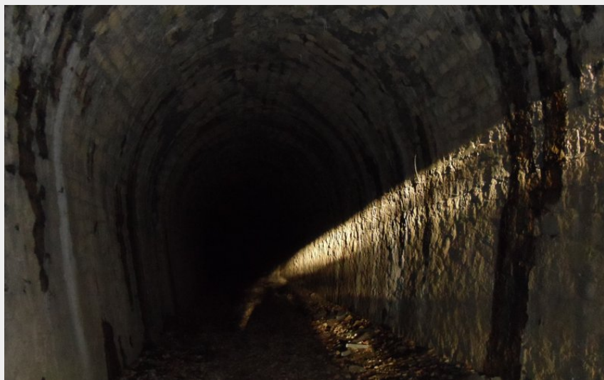
Sur les Traces de la Crémaillère - Tunnel de Pré Farnier