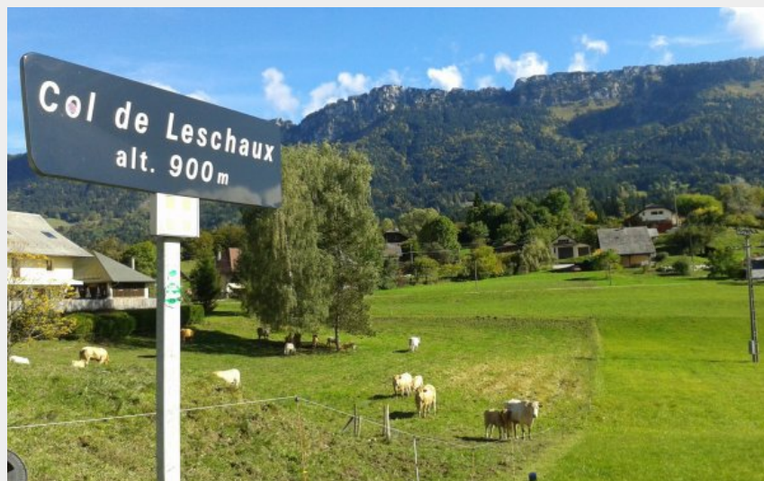
Au col de Leschaux