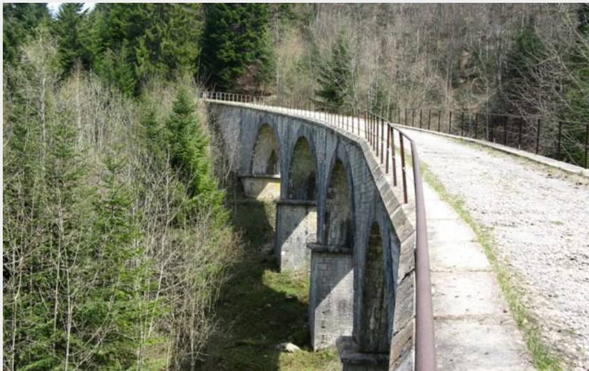
La crémaillère - viaduc des Fontanettes