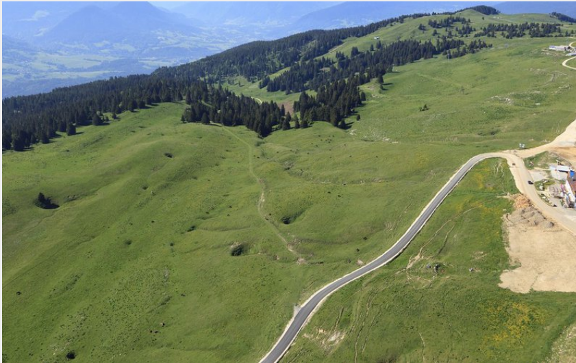
Au sommet du Semnoz