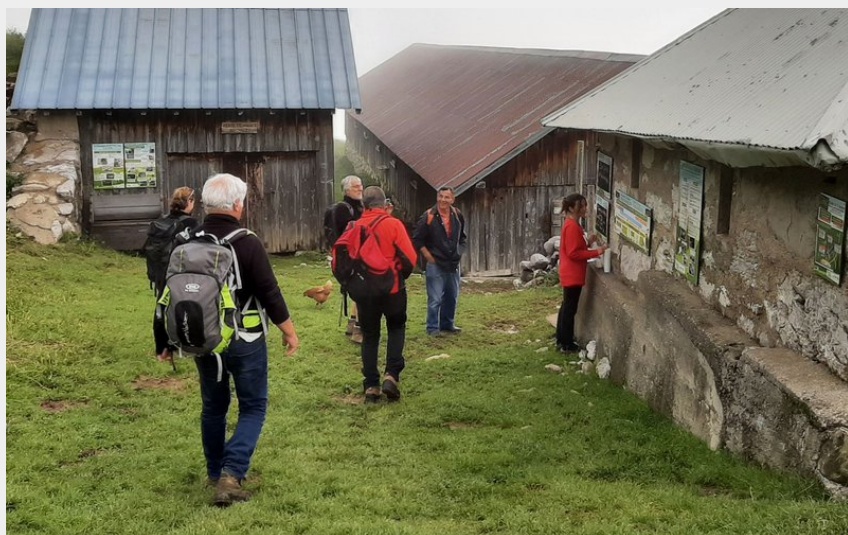
Les chalets de la Bouchasse