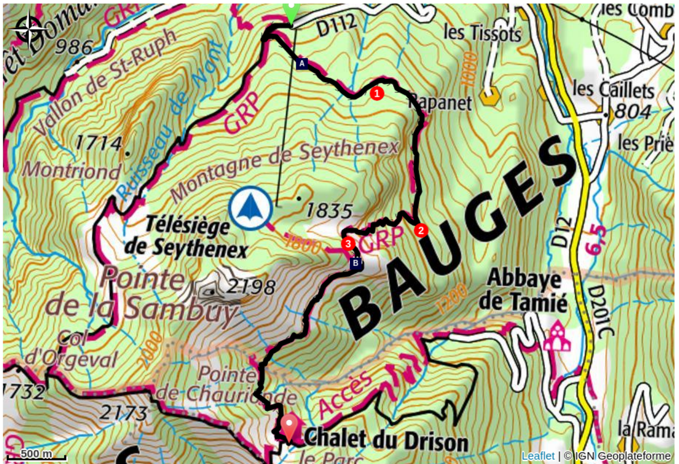
Station de la Sambuy (A)