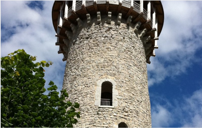
Le château de Faverges