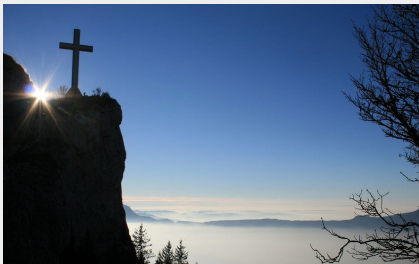
La croix du Nivolet