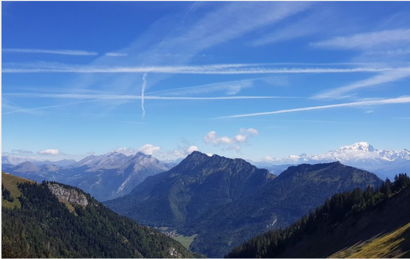
Point de vue depuis le col du Drison, avec notamment le Mont Blanc à droite