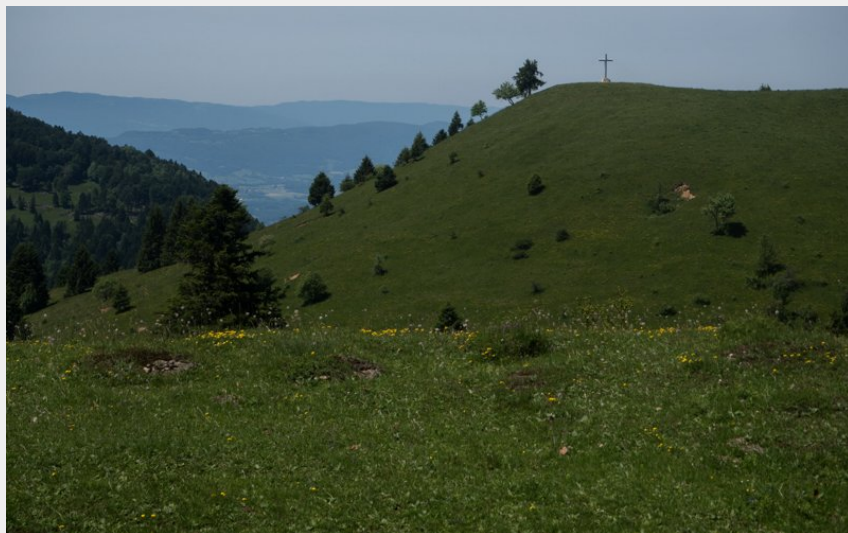
Croix des Bergers (Tifaine Briand)