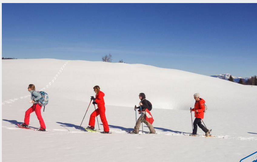
Crédit photo : Raquettes avec Fécl'aventure (Fécl'aventure_Ludmilla RIDOIN)