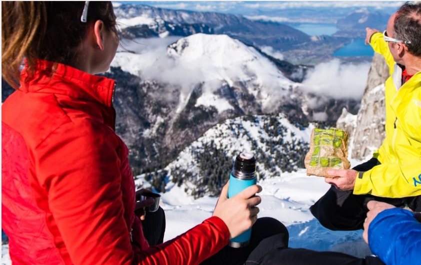
Seythenex La Sambuy