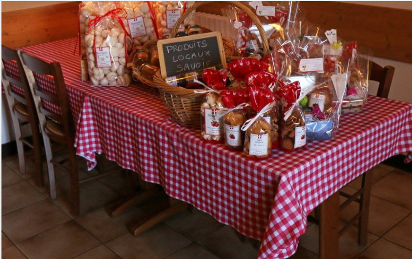
Crédit photo : Biscuiterie de la ferme de Ramée (Office de Tourisme de Challes-les-Eaux / G.Cann)