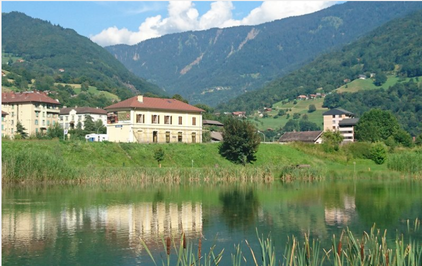
Crédit photo : Les locaux depuis le Parc des Berges de la Chaise (Bureau d'Information Touristique d'Ugine)