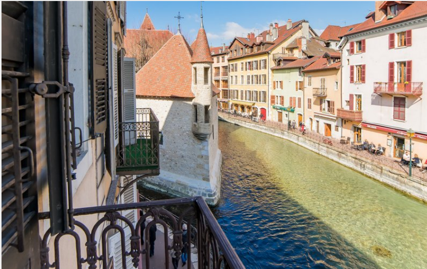
Crédit photo : Hôtel du Palais de L'Isle (Hôtel du Palais de L'Isle)