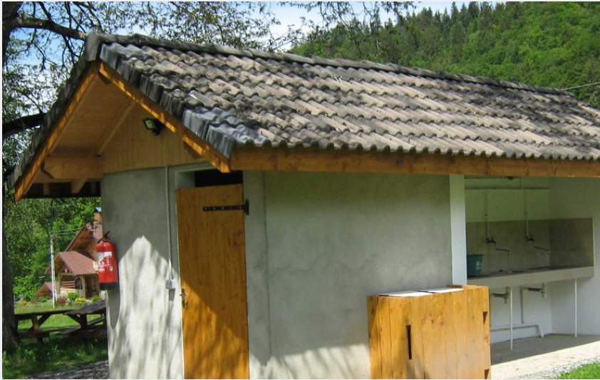
Crédit photo : Aire naturelle sanitaires (Aire naturelle La Recorbaz)