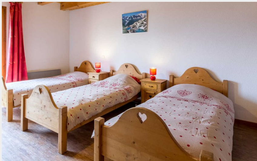
Chambre à 3 lits (90x140) au 1er étage