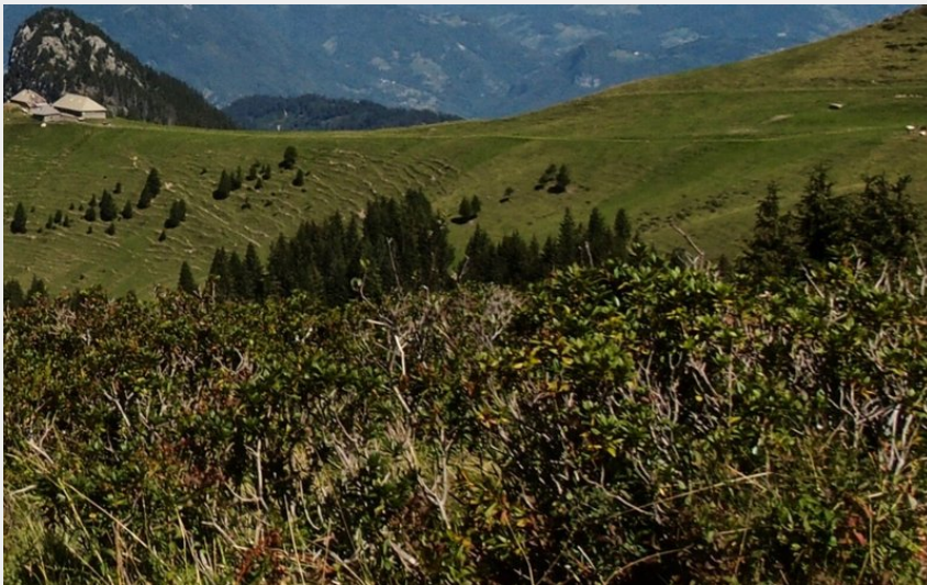
Aulpe de Seythenex panorama Tournette Bornes Aravis