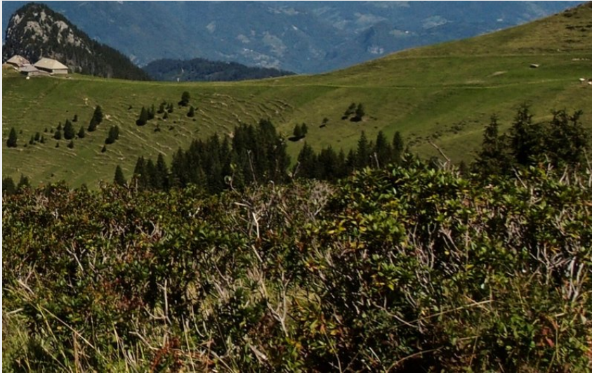
Aulp de Seythenex panorama Tournette Bornes Aravis