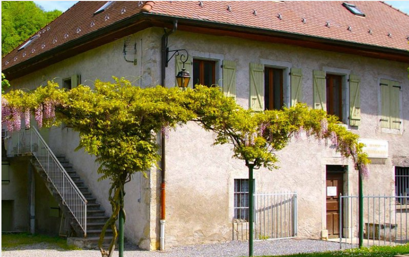
Crédit photo : musée archéologique de viuz Faverges extérieur (Musée de Viuz)